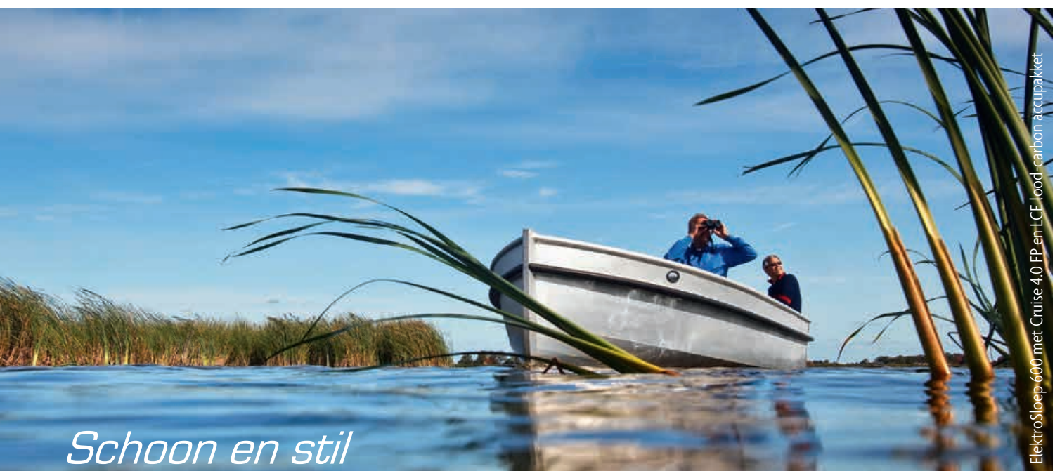
ElektroSloop 600 met Cruise 4.0 FP en LCE lood-carbon accupakket

Realiseert u zich wel dat elke boot anders is. Een slanke, lichte boot vaart bijvoorbeeld efficiënter dan een brede en zware. Maar ook het vaargebied is van belang. Bij varen op beschut water en voor kortere afstanden kan een lichtere motor toegepast worden dan bij varen op ruim water. Raadpleeg hiervoor altijd uw dealer.