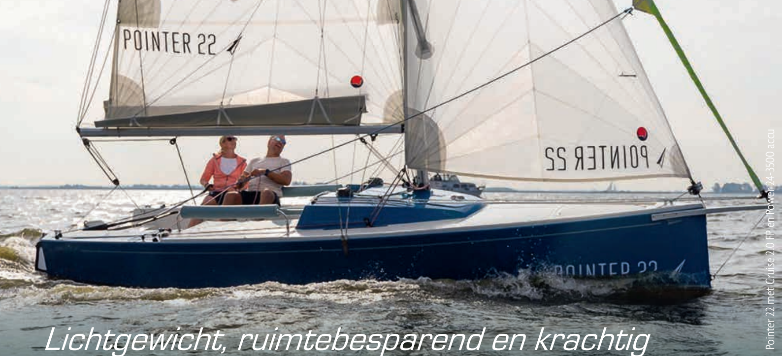
Pointer 22 met Cruise 2.0 FP en Power 24-3500 accu