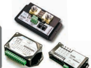
PICO one (+1)